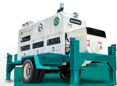
BOMBA DE CONCRETO REBOCÁVEL EVOMAQ ®