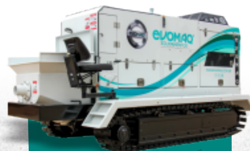
BOMBA DE CONCRETO SOBRE ESTEIRA EVOMAQ ®