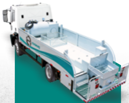
AUTO BOMBA DE CONCRETO EVOMAQ ®